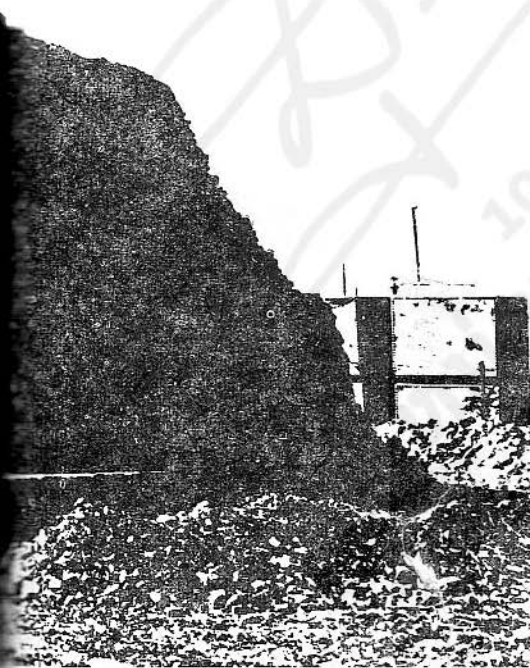
ศาสตราจารย์ หม่อมเจ้าสุภัทรดิศ ดิศกุล ทรงแปลเป็นภาษาไทย

ในบรรดาสถานที่อันศักดิ์สิทธิ์ที่พระบาทสมเด็จพระจอมเกล้าเจ้าอยู่หัวซึ่งเราเพิ่งได้ฉลองวันสวรรคตครบรอบ ๑๐๐ ปีของพระองค์ไปเมื่อเร็ว ๆ นี้ได้เสด็จไปทรงเคารพบูชาหนักคือเมืองนครปฐมนี้เองที่ทำให้พระองค์ทรงสนพระทัยในทางด้านโบราณคดีเป็นครั้งแรก และความสนพระทัยนี้ก็มีอยู่ตลอดต่อไปด้วย แม้ก่อนที่พระองค์จะเสด็จขึ้นเสวยราชย์ คือใน พ.ศ. ๒๓๗๔ อันเป็นเวลา ๗ ปีภายหลังจากที่ได้เสด็จออกทรงผนวช เจ้าฟ้าชายมงกุฎก็ได้เสด็จจรดงค์ไปยังพระปฐมเจดีย์ ณ ที่นั้นภายหลังจากได้ทรงประทับนิพนธ์พระสฎูปแล้ว เจ้าฟ้าชายมงกุฎก็ได้รับสั่งถึงความสำคัญเป็นพิเศษของพระปฐมเจดีย์ ท่อกลุ่มสานุศิษย์ที่ตามเสด็จมาด้วย และทรงตั้งพระปณิธานที่จะกระทำทุกประการเพื่อบูชาพระสารีริกธาตุซึ่งพระองค์ทรงคิดว่าประดิษฐานอยู่ภายใน พระปณิธานนี้ได้ทรงประพันธ์เป็นคาถาภาษาบาลี และย่อม