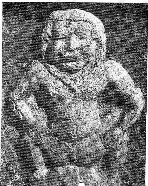
ภาพปูนปั้นสิ่งทวารบาล ประจำฐานเจดีย์จุลปะไท ในการก่อสร้างครั้งที่ ๒