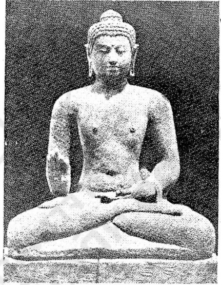
(รูปที่ ๕) พระสมันตภัทรโพธิสัตว์ ? เหนือฐานซีกที่ ๕ ณ บุโรพุทโธ.

หมายถึงพระสมันตภัทร พระองค์เห็นพระพักตร์ไปยังทิศทั้งสี่และอยู่เหนือพระธยานิพุทธอีก ๔ พระองค์ อันหมายความว่าพระองค์ทรงเป็นพระธยานิพุทธองค์กลาง พระพุทธรูปแถวนี้ทรงแสดงปางวิตรรกะหรือทรง สั่งสอน อันเป็นปางของพระสมันตภัทรด้วย (ดูรูปที่ ๕) สมเด็จพระกัมภีร์คันทาพยูหะกล่าวว่าพระสมันตภัทรทรงเป็นครูและผู้นำของพระสุธนโพธิสัตว์ในการแสวงหาพระธรรม ภาพสลักจึงกล่าวจบลงด้วยคำสาบานเกี่ยวกับพระสมันตภัทรบนลานสี่เหลี่ยมชั้นสูงสุดอันสุดเขตรูปธาตุ ก่อนที่จะเข้าไปสู่เขตอรูปธาตุ และเราก็ยังไม่ลืมด้วยว่าพระสมันตภัทรนั้นทรงเป็นเจ้าของแห่งความเร้นลับ และก็คือกฎแห่งความเร้นลับเหล่านี้ที่เรียกว่า “บรมกฤษณะ” หรือ “รหัสยะ” ที่พระสมันตภัทรทรงสั่งสอนแก่พระสุธนก่อนที่พระสุธนจะเข้าไปสู่อรูปธาตุ ดังนั้นจะเห็นว่าปางวิตรรกะย่อมเหมาะสมอย่างยิ่งสำหรับพระสมันตภัทร เหตุนี้ที่บุโรพุทโธนี้คงนับถือพระสมันตภัทรว่าเป็นพระธยานิพุทธองค์กลาง ในกัมภีร์จันทกถณ์ซึ่งเก่าเดิมอาจเก่าไปถึงสมัยราชวงศ์โคเลนทร์ ก็กล่าวว่าพระนาม “สมันตภัทร” อาจใช้แทนคำว่า “พระพุทธเจ้า” ได้