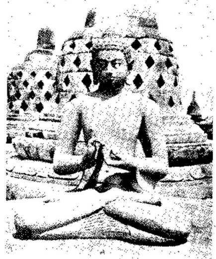
(รูปที่ ๕) พระไวโรจนะ ในสลุป ๓ แถวล้อมรอบสลุปองค์กลาง ณ บุโรพุทโธ

ต่อจากนั้นศาสตราจารย์ พัน โสขุยเซน ได้กล่าวถึงพระพุทธรูปที่อยู่ในสลุปซึ่งจะเป็นรูป ๓ แถวบนลานชั้นบนของบุโรพุทโธ เธอกล่าวว่าเธอเห็นด้วยกับศาสตราจารย์กรม (Krom) ที่ว่า ณ บุโรพุทโธนี้ มีการนับถือพระธยานิพุทธ ๖ พระ องค์แทนที่ ๕ พระองค์ แต่เธอก็ไม่เห็นด้วยกับ ศาสตราจารย์กรมที่ว่าพระธยานิพุทธองค์ที่ ๖ ใน สลุป ๓ แถวล้อมรอบสลุปองค์กลางนี้ คือ พระวิษ ณุสวัตนี ทั้งนี้ เพราะพระวิษณุสวัตนี้นั้นจะทรงถือวัชรและ ระฆังอยู่เสมอ พระธยานิพุทธในสลุป ๓ แถวนั้นกลับ ทรงแสดงปางปฐมเทศนา (รูปที่ ๕) ในเกาะชวา เองก็ได้ค้นพบประติมากรรมสัมฤทธิ์ที่แสดงภาพ พระวิษณุสวัตนี้นั่งทรงถือวัชรและระฆังอยู่บ่อย ๆ นอกจากนี้ พระวิษณุสวัตนี้นั่งทรงถือวัชรและระฆังอีก ด้วย และความเคารพนับถือพระวิษณุสวัตนี้นี้เห็น มีขึ้นระหว่าง พ.ศ. ๑๔๕๐-๑๕๐๐ เท่านั้น คัมภีร์