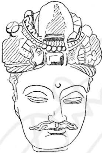
ภาพลายเส้นที่ ๑๑ พระโพธิสัตว์ที่พิพิธภัณฑสถานเมืองเปศวาร์ ทรงผมแบบ ก. ศิลปอินเดียสมัยคันธารราชู

และประมาณขนาดล้อมรอบพระองค์ปรากฏอยู่ แม้ว่าจะชำรุดแต่ก็คงแสดงปางสมาธิ พระพุทธรูป องค์นี้ประทับเหนือคอกบัว ใต้คอกบัวมีวงโค้งครึ่งวงกลมซึ่งยื่นต่อดลงมาจากขอบของชายผ้าเป็น วงกลม ประกอบด้วยแผ่นที่มีลายกตโค้งอยู่ท่ามกลางแนวเรียบ ๒ แนว