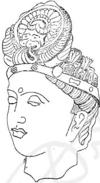
ภาพลายเส้นที่ ๑๕ พระโพธิสัตว์ที่พิพิธภัณฑสถานเมืองลัคเนา ทรงผมแบบ ก. ศิลปะอินเดียสมัยมถุรา

ซึ่งยังคงอยู่ก็แสดงให้เห็นถึงปริณิเทศที่สมบูรณ์ซึ่งผ้าได้แผ่ขยายออกเป็นกลีบ เข็มกลัด ซึ่งยึด กลีบเหล่านี้ประกอบด้วยสายลูกประคำ ถักซึ่งมีหน้าสิงห์ยื่นออกมาสวมสายลูกประคำหรือกระดิ่ง เล็ก ๆ สิ่งนี้ห่มชายผ้า ๒ ชายไว้ในปากและตรงกลางก็มีสายลูกประคำห้อยตกลงมา ลวดลาย