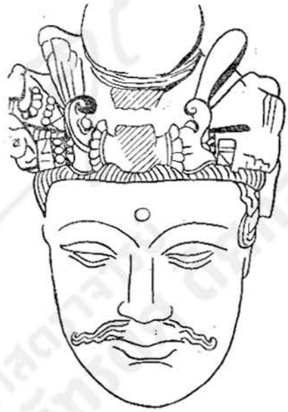
ภาพลายเส้นที่ ๑๒ พระโพธิสัตว์ที่พิพิธภัณฑสถานเมืองละฮอร์ ทรงผมแบบ ก. ศิลปอินเดียสมัยคันธารราชู

ยกเว้นพระพุทธรูปขนาดเล็กซึ่งได้กล่าวมาแล้วว่ามีอยู่เฉพาะบนชายผ้าเป็นวงกลม ซึ่งค้นพบที่ตาคอฮาไฮ (Takht-i-Bahai) ทรงผมแบบนี้ก็มีอยู่เป็นประจำในศิลปคันธารราชู เราอาจเปรียบเทียบทรงผมแบบนี้ได้กับทรงผมของเศียรอีก ๒ เศียรซึ่งอยู่ในพิพิธภัณฑสถานเมืองเปช- วาร์ (ภาพลายเส้นที่ ๑๑) และพิพิธภัณฑสถานเมืองละฮอร์ (ภาพลายเส้นที่ ๑๒) แม้ว่าในสอง เศียรหลังนี้ชายผ้าเป็นวงกลมของผ้าโพกศีรษะจะได้หักหายไปแล้ว และลวดลายตรงกลางเมื่อ ล่างก็ผิดแผกไปจากเศียรที่เมืองซีกาโก (รูปที่ ๑ และภาพลายเส้นที่ ๑๐) เพราะเหตุว่าได้กลับ กลายเป็นพลอยรูปสี่เหลี่ยมผืนผ้า (ที่บรรจุพระสารีริกธาตุ) ไป