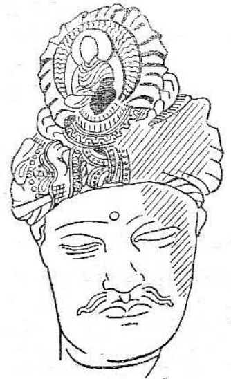
ภาพลายเส้นที่ ๑๐ พระโพธิสัตว์อวโลกิเตศวร ที่พิพิธภัณฑ์ฟิลด์ เมืองซีกาโก ทรงผมแบบ ก. ๑ ศิลปอินเดียสมัยคันธารราชู

ในศิลปคันธารราชู (รูปที่ ๑ และภาพลายเส้นที่ ๑๐) ทรงผมของพระโพธิสัตว์อวโลกิเตศวรมีลักษณะดังต่อไปนี้ ซึ่งจะเรียกว่า แบบ ก. ๑ คือ ผ้าโพกศีรษะประกอบด้วยส่วนกลางเป็นสร้อยลายลูกประคำผูกเป็นปม ทางด้านขวาของ “ปม” นี้มีชายผ้าบิดเป็นเกลียวและแนวลายกลีบบัวอยู่ระหว่างแนวแคบ ๆ ๒ แนว ถัดจากนั้นเป็นรูปหน้าสัตว์มองเห็นทางด้านข้าง อ้าปาก แลปลิ้นออกมา ๒ ปลิ้น ระหว่าง ๒ ปลิ้นนี้มีสายลูกประคำซึ่งแบ่งออกเป็นเส้นตรง ๒ สาย เห็นอวลคล้ายตรงกลางซึ่งเป็นปมมีชายผ้าเป็นวงกลมมีผ้าซึ่งขมวดควม้วนรองรับอยู่ทั้งสองด้าน ในชายผ้าเป็นวงกลมมีวงกลมซึ่งประกบด้วยรัศมีคดโค้งล้อมรอบ เหนือรัศมีนั้นมีพระพุทธรูปขนาดเล็ก ซึ่งมีทั้งรัศมีล้อมรอบพระเศียร