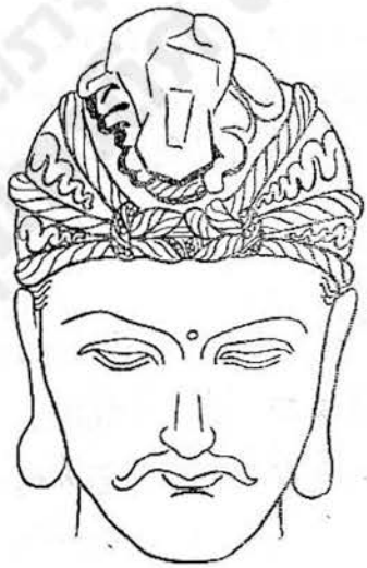
ภาพลายเส้นที่ ๑๓ พระโพธิสัตว์อวโลกิเตศวรเลขที่ B-30 ที่พิพิธภัณฑน์เมืองสาญซี ทรงผมแบบ ก. ๓ ศิลปอินเดียสมัยมถุรา