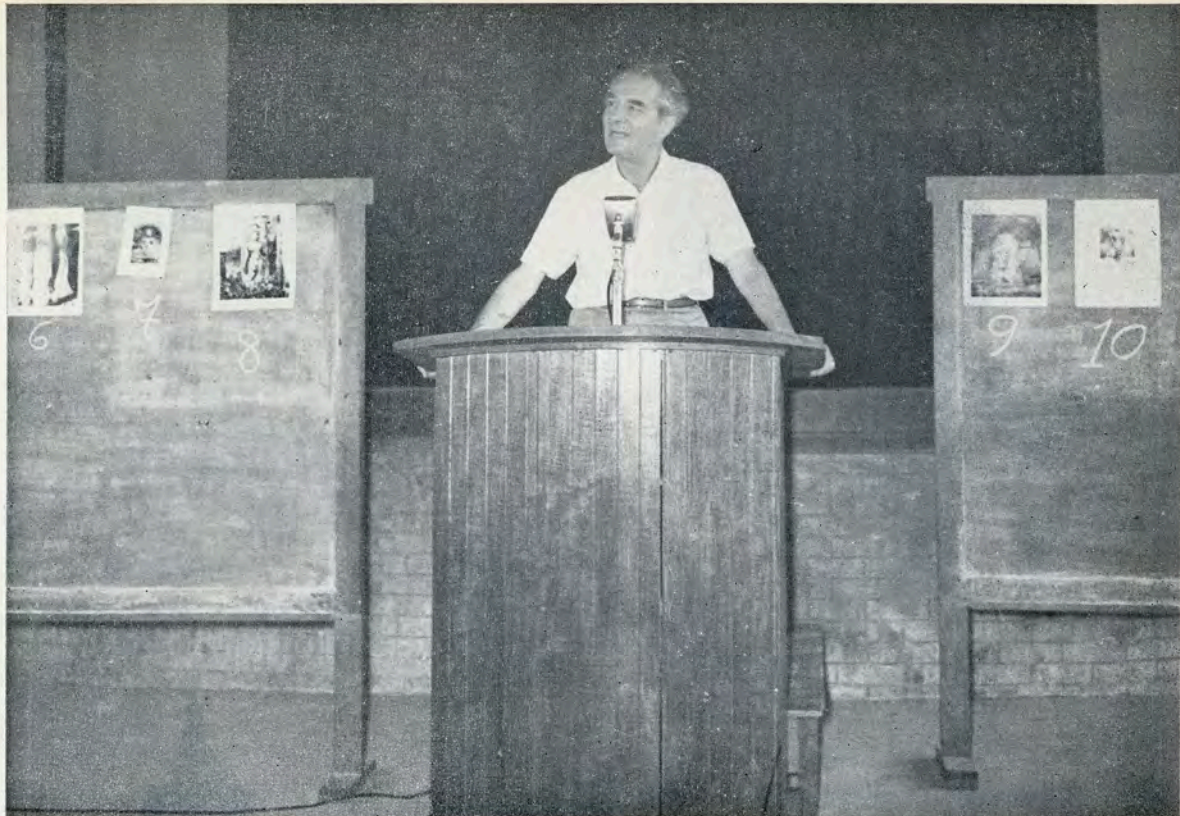
ศาสตราจารย์ศิลป์ พีระศรี ผู้บรรยายเรื่องจิตรกรรม และประติมากรรมสมัยสุโขทัย