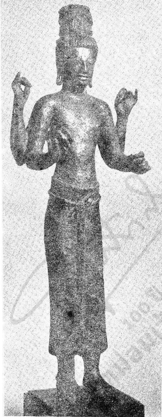
1. พระโพธิสัตว์กวีอริยมหาคโรธ ๔ กร สัมฤทธิ์ สูง ๕๖ ซม. Four armed Maitreya Bodhisattva Bronze 46 cm.