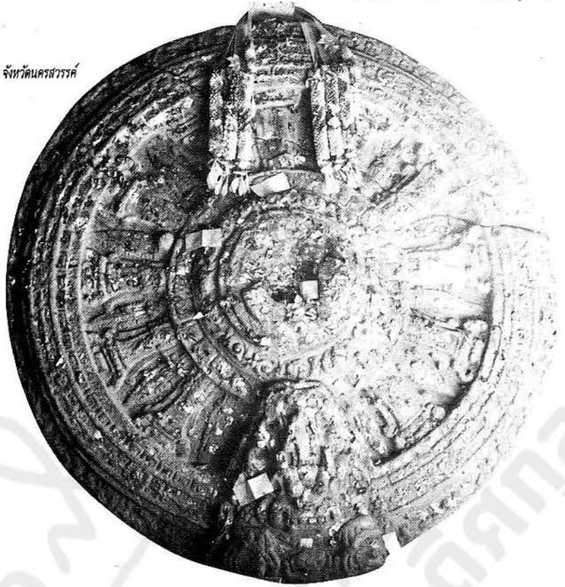
ธรรมจักรศิลา พบที่เมืองเสมา อำเภอสูงเนิน จังหวัดนครราชสีมา

ดังนั้นทำให้เราทราบได้ว่าในสมัยของพระภิกษุจีน เขียนซึ่งผู้ไม่เคยเดินทางเข้ามาในแหลมอินโดจีนเลยนั้น มีรัฐอยู่ 3 รัฐจากทางทิศตะวันตกไปยังทิศตะวันออก คือ ศรีกษัตริ ทวารวดี และ อีสานปุระ