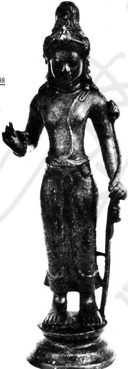
พระโพธิสัตว์อวลโลกิศจิตร สลักขึ้นที่เมืองอุทอง สุพรรณบุรี