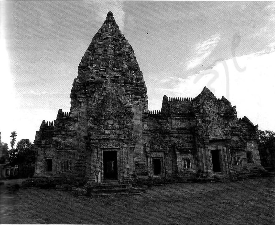
ปราสาทหินพนมรุ้ง ตัวอย่างโบราณสถาน แบบลพบุรี