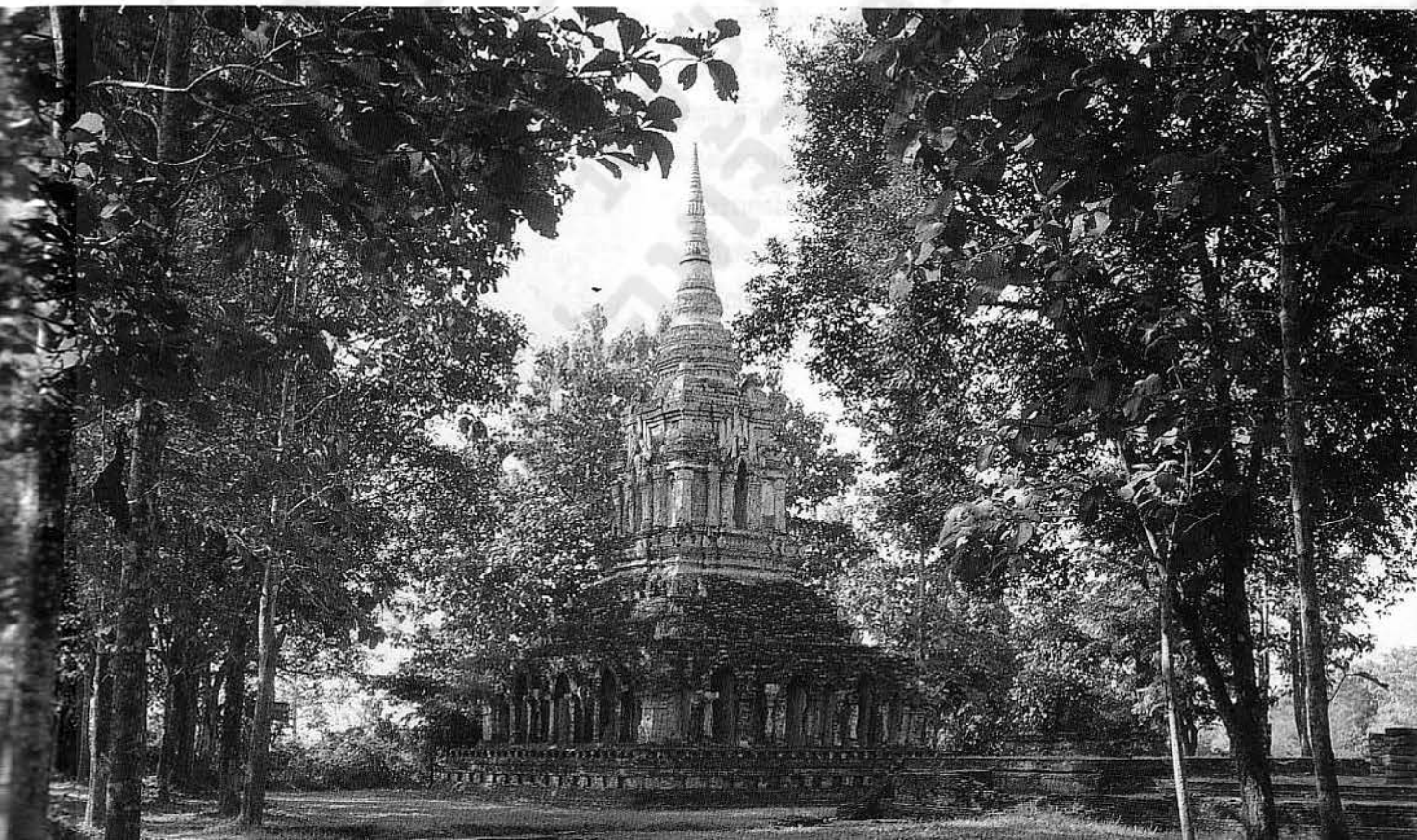
เจดีย์วัดป่าสัก โบราณสถาน แบบไทยภาคเหนือ