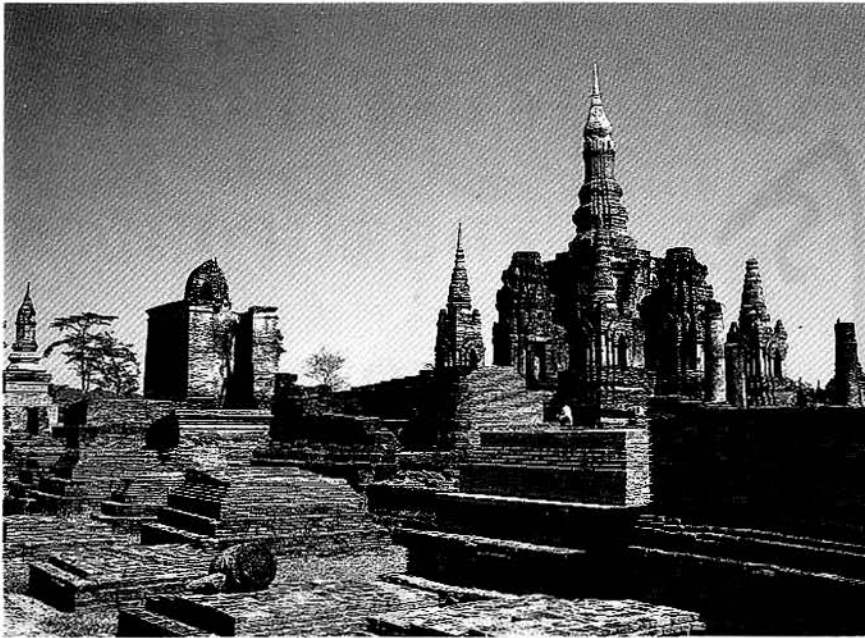
โบราณสถานแบบสุโขทัย ในอุทยานประวัติศาสตร์สุโขทัย