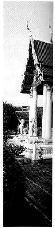
วัดเบญจมบพิตรฯ สถาปัตยกรรมแบบรัตนโกสินทร์

ส่วนอาคารที่แสดงถึงอิทธิพลต่างประเทศนี้ ก็สมควรที่จะได้รับการบำรุงรักษาเพื่อแสดงถึงลักษณะที่น่าสนใจทางด้านสถาปัตยกรรมและการสืบทอดทางด้านประวัติศาสตร์ ปัจจุบันอาคารดังกล่าวหลายแห่งได้รับการขึ้นทะเบียนจากกรมศิลปากร นำเสียดายที่ว่า