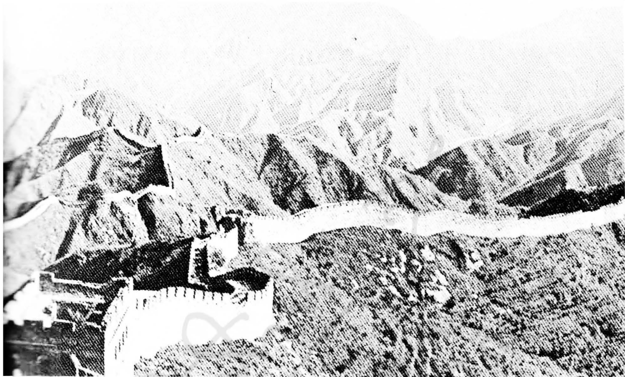
กำแพงเมืองจีน

ซึ่งเข้าใจกันว่าสร้างขึ้นในสมัยจักรพรรดิฉินซี