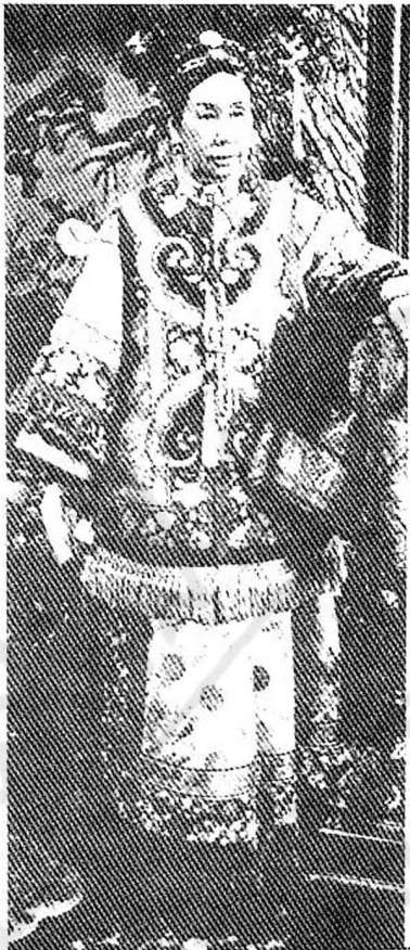
พระนางซูสีไทเฮา

เขียนหลงก็เชื่อถือลัทธิขงจื้อเหมือนกัน กั๋งอี่ หยงเจินและเขียนหลง ไม่ยอมให้ชนชาติจีนเรียกรวมวิชาการใหม่ ๆ เพราะกลัวว่าจะมาคิดกบฏ แล้วในขณะที่เดียวกันพวกแมนจูก็ได้ได้เฉพาะแต่ทหารอย่างเดียว ทำอาชีพอื่นไม่ได้ ซึ่งตอนหลังไม่เคยบออะไรกับใคร ๑๐๐ กว่าปี มีมือถืออ่อนลง ๆ ตอนปลายรัชกาลเขียนหลงจีนเริ่มรุ่งแล้ว พรรคมังขว (White Lotus) มีจริง ๆ เป็นพรรคในพุทธศาสนาว่าเกิดขึ้นในปลายสมัยเขียนหลง คือ หนึ่งกำลังภายในของจีน เมื่อเอ่ยชื่อเมืองหลวง เอ่ยชื่อราชวงศ์ ผกก็พอจะดังเข้ามาอยู่ที่ไหนได้ในประวัติศาสตร์จีน แต่บางทีไม่เอ่ยชื่อเมืองหลวงและราชวงศ์ผมก็สนใจ เรื่องบางเรื่องผมชอบ